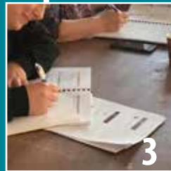
FORMATION EN ATL